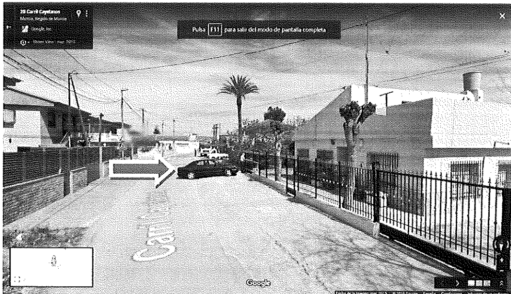
Arreglo de calzada del margen derecho del carril de los Cayetanos de Zarandona, Murcia