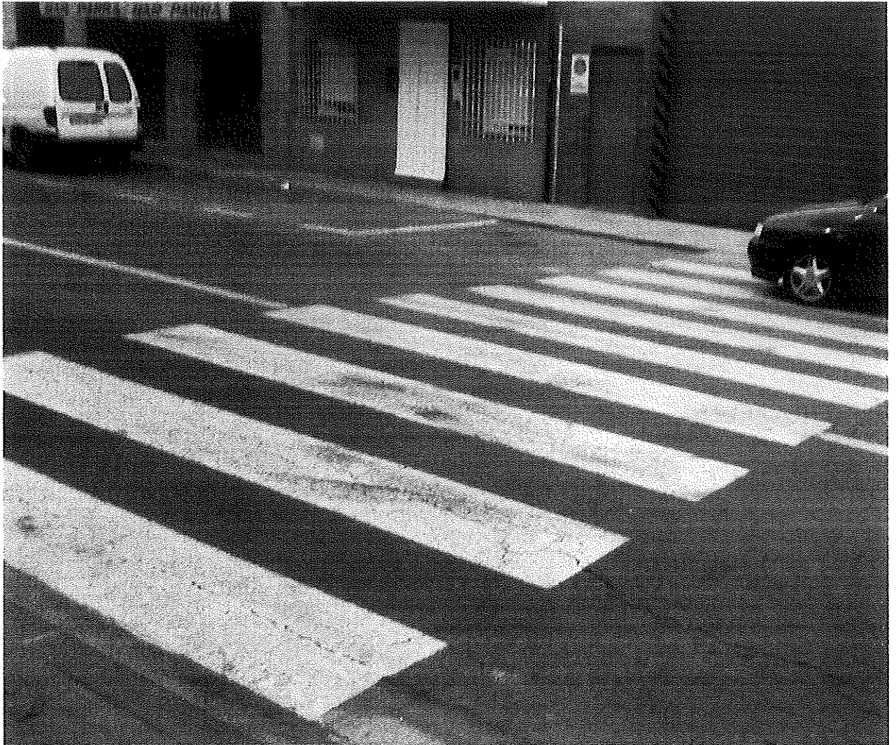
Avda José Alegría, Zarandona, Murcia, paso peatones a la altura de Bar Parra y Taller Zarandona, en dirección a Ctra. Alicante.

GRUPO SOCIALISTA DE ZARANDONA JUNTA MUNICIPAL