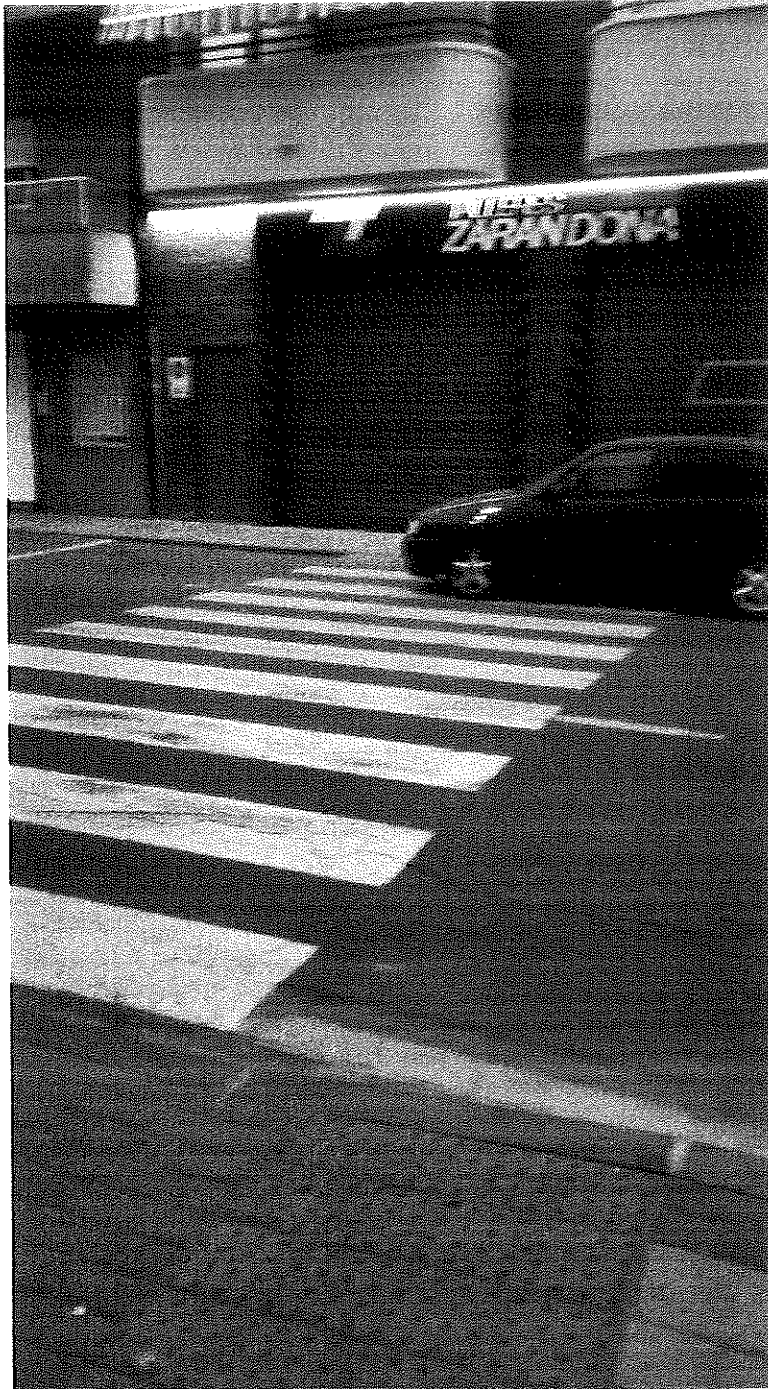
Avda José Alegría, Zarandona, Murcia, paso peatones a la altura de Bar Parra y Taller Zarandona, en dirección a Ctra. Alicante.

GRUPO SOCIALISTA DE ZARANDONA JUNTA MUNICIPAL