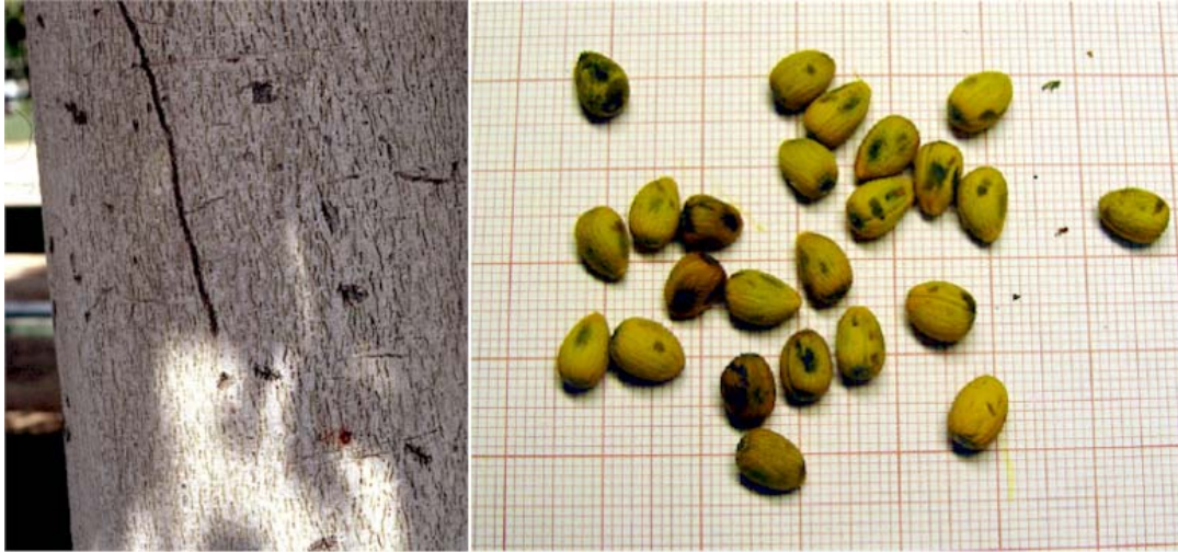
Detalle de la corteza del tronco y de las semillas