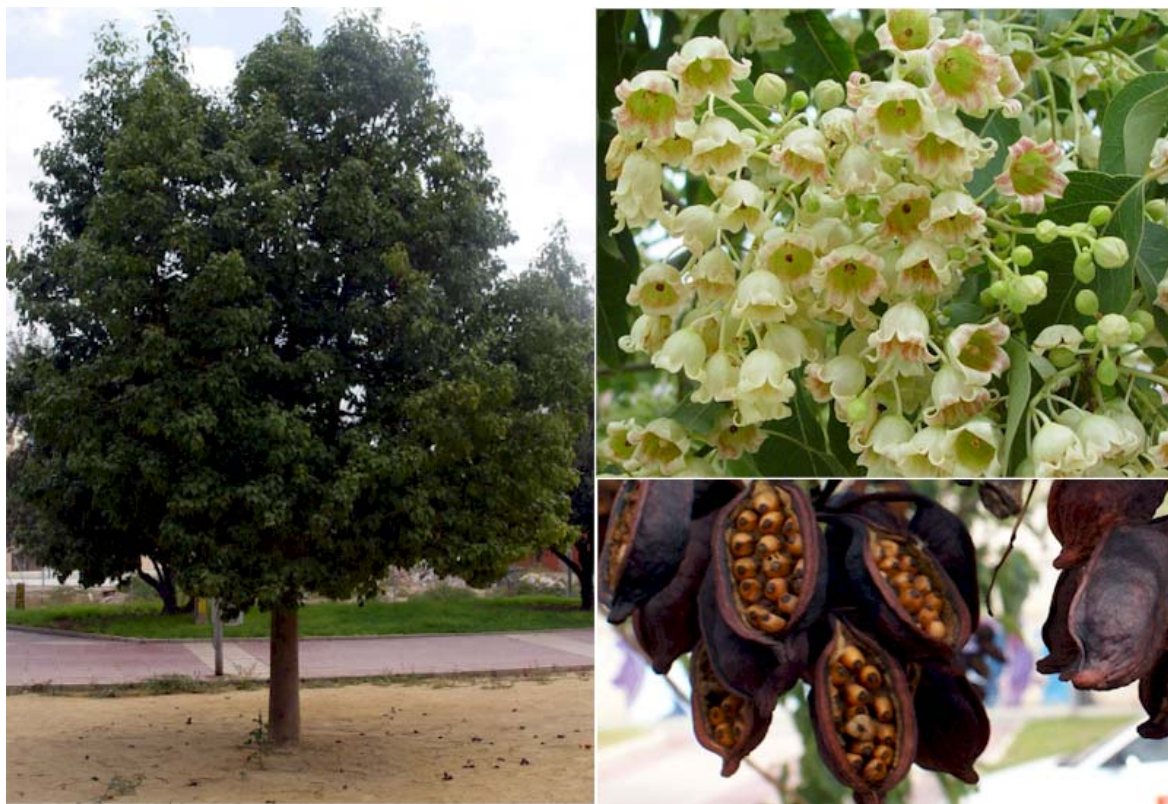
Aspecto general y detalle de las flores y de los frutos mostrando las semillas

Nombre común: braquiquito, árbol botella.