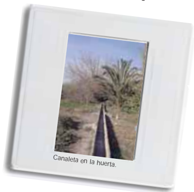
Canaleta en la huerta.

La mayoría de estos ejemplares aparecen cerca de las acequias quienes le proporcionan abundante humedad. Este hecho, junto con la presencia de un buen suelo y el agradable clima existente han permitido que los pinos alcancen hasta 20 metros de altura y vivan alrededor de 100 años. Este desarrollo es muy superior al de los ejemplares de Pinos piñoneros que habitan en otras zonas de la Región.