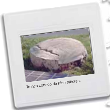
Tronco cortado de Pino piñonero.

Analizando la disposición de los anillos de los troncos cortados se puede averiguar el clima que hacía en épocas pasadas. El agua, principal factor que condiciona el crecimiento de los árboles, era abundante cuando los anillos aparecen separados; año de buen crecimiento gracias a la cantidad de agua disponible. En cambio cuando los anillos aparecen muy juntos es señal de que en ese año los árboles dispusieron de menos agua.