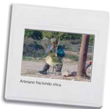
Artisano haciendo sisca.

La pedanía de Churra se caracteriza por preservar la tradición navideña del Auto de los Reyes Magos, que se celebra el día 6 de enero.