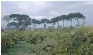
La pinada asomando sobre la huerta.

El Pino piñonero ( Pinus pinea L.) es la especie más característica de este lugar. Es fácil distinguirlo de otros pinos tanto por su rojiza corteza que se cuartea en placas como por la forma de sombrilla que presenta su densa copa. Posee, además, grandes piñas que salen directamente de las ramas, sin pedúnculo, y que dan los piñones que nos comemos.